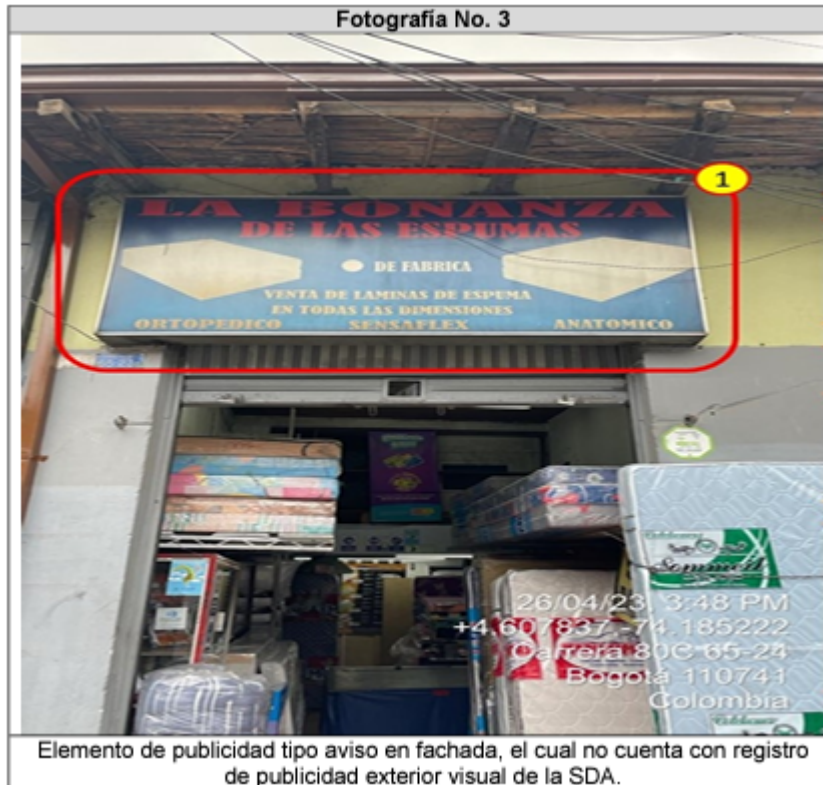
Elemento de publicidad tipo aviso en fachada, el cual no cuenta con registro de publicidad exterior visual de la SDA.