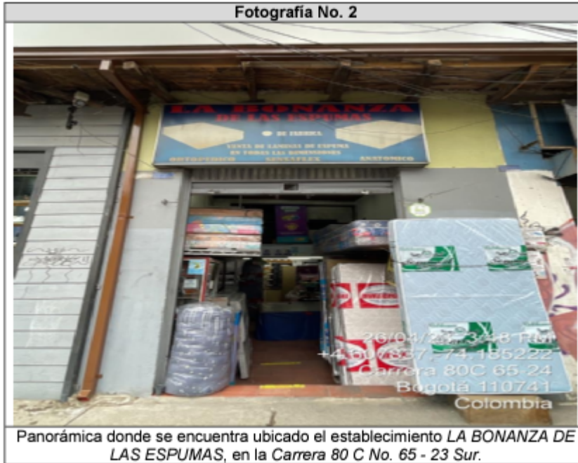
Panorámica donde se encuentra ubicado el establecimiento LA BONANZA DE LAS ESPUMAS, en la Carrera 80 C No. 65 - 23 Sur.